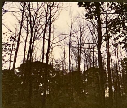
Parcelle 77 — Route des Princesses Forêt domaniale de Marly Octobre 2020

Il s'agit d'un pathogène appelé Phytophthora qui attaque le système racinaire des châtaigniers.